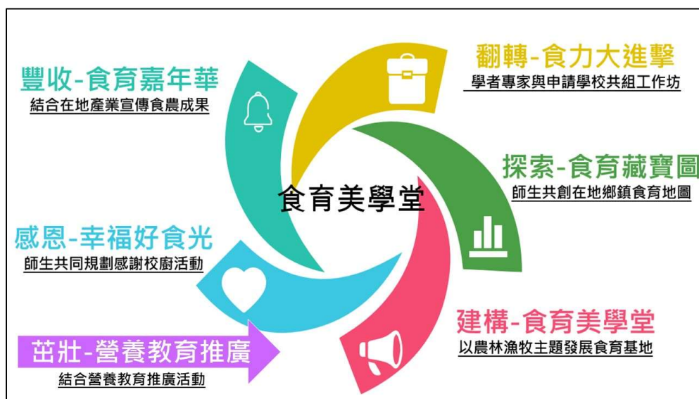
圖 2 本縣食育美學堂概念圖